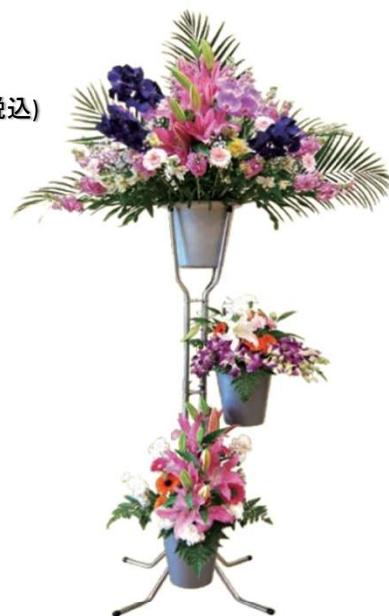
一基 33,000円 (税込)