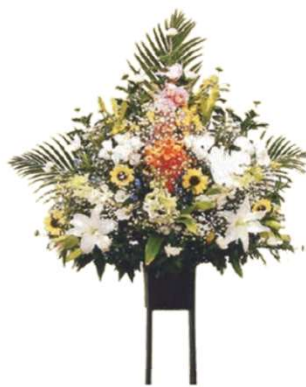
一基 16,500円 (税込)