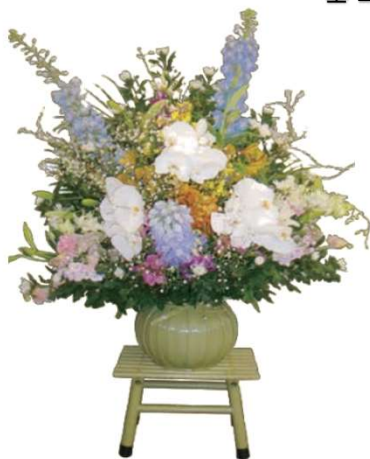
一基 22,000円 (税込)