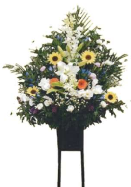
一基 11,000円 (税込)