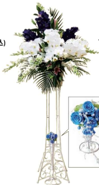
一基 27,500円 (税込)