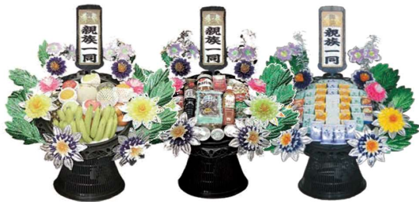
(果物・乾物・フリーズドライ) 一基 10,800円 (税込)