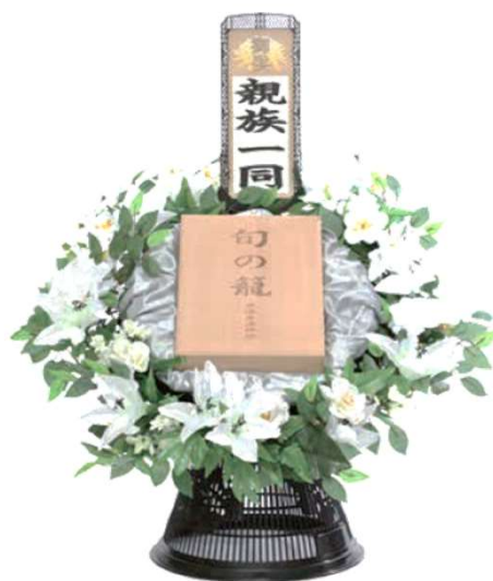
(選べる全国から取り寄せの品のカタログギフト付き) 一基 11,000円 (税込) 送料無料